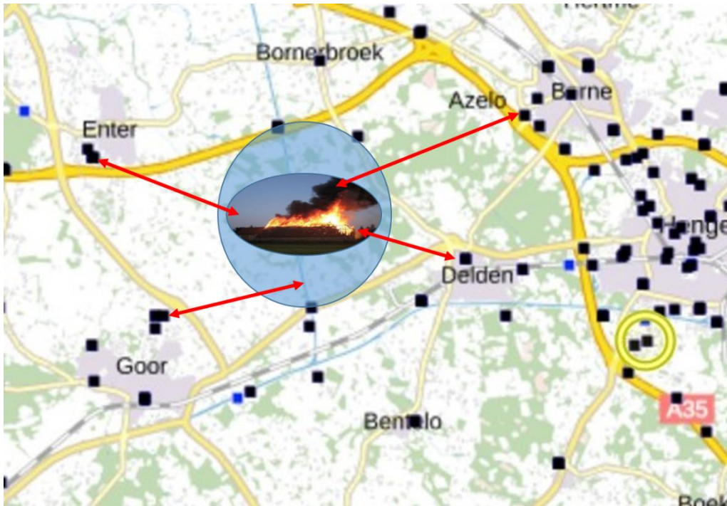
Figuur 1: Uitzendgebied te klein om zeker te stellen dat burgers een NL-Alert ontvangen

Hoe kan je er voor zorgen dat de meeste burgers in dit gebied een NL-Alert ontvangen? Zie figuur 2. Om zeker te stellen dat burgers in het uitzendgebied een NL-Alert ontvangen, moeten de omliggende dorpen in de gebiedsselectie worden opgenomen.