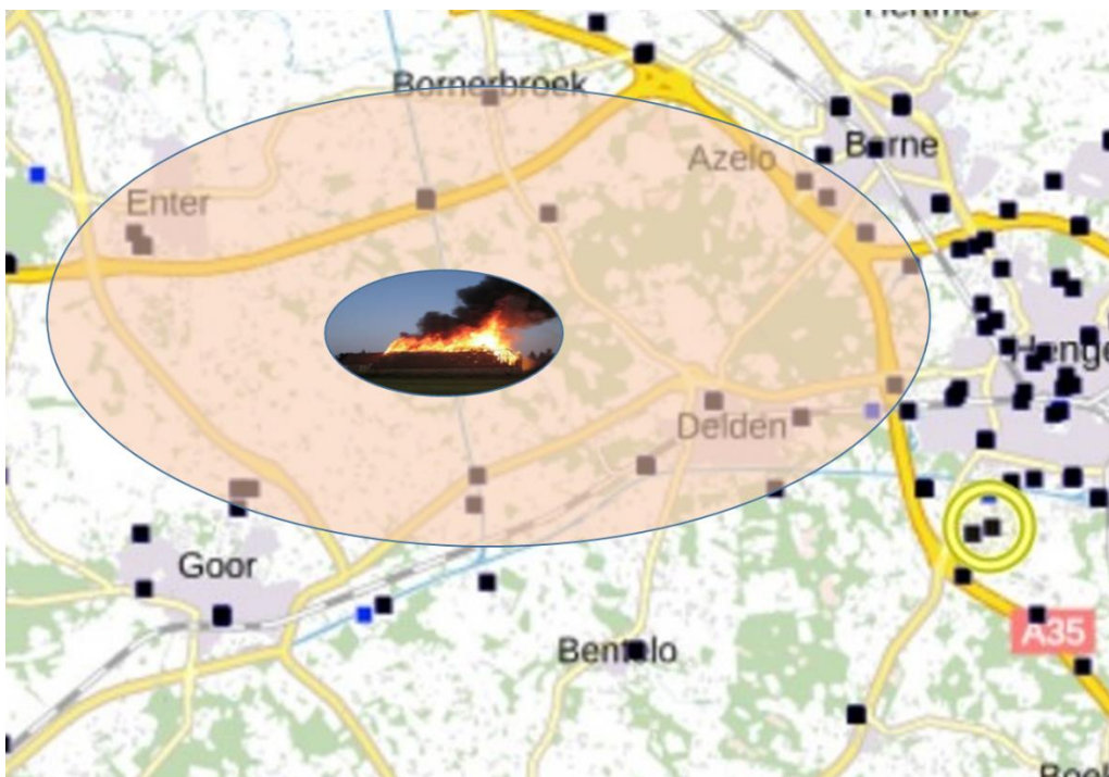
Figuur 2: Uitzendgebied is vergroot om zeker te stellen dat burgers uit het in figuur 1 weergegeven selectiegebied een NL-Alert ontvangen

Hoe kan je er voor zorgen dat de meeste burgers in dit gebied een NL-Alert ontvangen? Zie figuur 2. Om zeker te stellen dat burgers in het uitzendgebied een NL-Alert ontvangen, moeten de omliggende dorpen in de gebiedsselectie worden opgenomen.